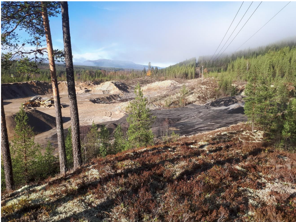
Bilde mot eksisterende grustak

Det ble ikke registrert automatisk fredete kulturminner.