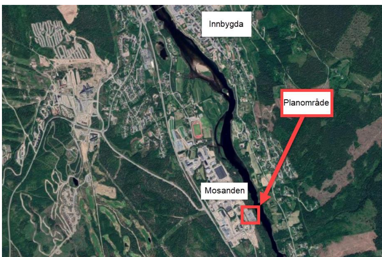
Figur 1 Figuren viser hvor planområdet ligger i Trysil kommune.

Renseanlegget som nå skal utvides ligger på Mosanden i Trysil kommune. Dette er et større industriområde ca. 2.5 km sør for avkjøringen til Innbygda. Planområdet består i dag av eksisterende renseanlegg og annen industri knyttet til industriområdet. Planområdet berører eiendommene 37/1381, 37/1661, 37/457, 37/1425, 37/524, 37/505, 37/764, 0/1.